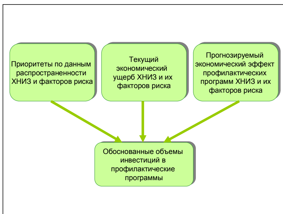
Рис. 3 Роль эпидемиологического мониторинга в обосновании объема инвестиций в профилактические программы

Эпидемиологический мониторинг может стать важным инструментом обоснованного распределения ограниченных ресурсов системы здравоохранения как федеральном, так и на региональном уровнях (рис. 3).